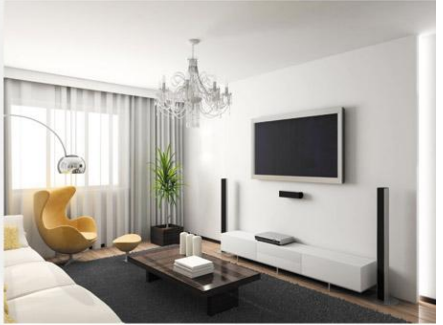
કલાત્મક સ્પર્શ દર્શનિય હોય છે, મનભાષણ આકાર નયનરમ્ય હોય છે.

એવી નિરાળી નિર્માણ વ્યવસ્થા, જ્યાં માનવીય સુવિધા સર્વોપરી હોય, અહીં આપનું સ્વાગત છે.